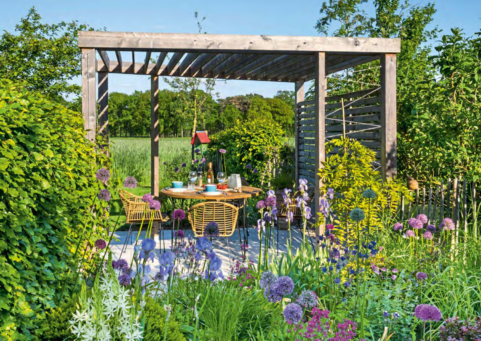
Als Essplatz mit Blick in die Landschaft und auf Zierlauch, Iris, Steppenlilie und Akelei lädt die Terrasse unter der Pergola ein.

„Es ist einfach ein ganz tolles Gefühl, auch mal mitten in den Pflanzen zu sitzen.“